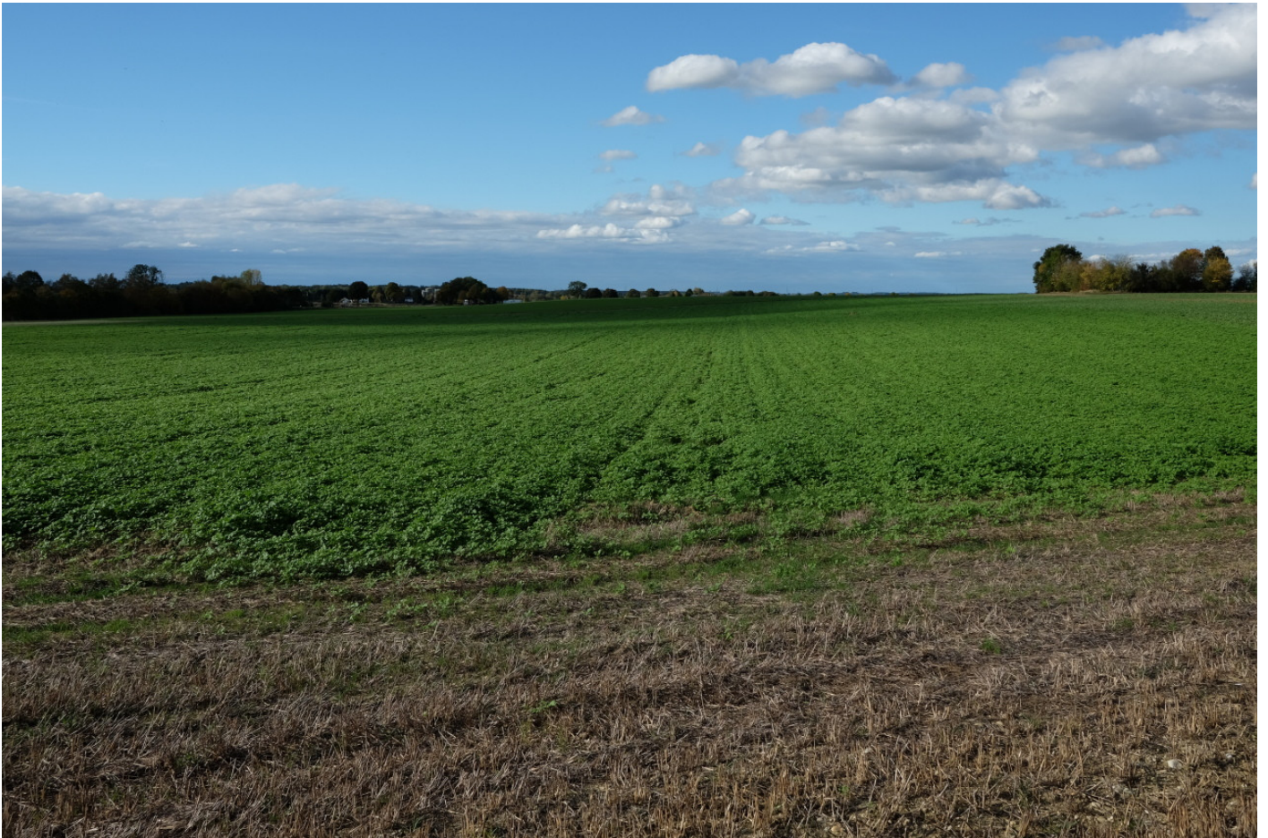
Der Anstieg nach Mittbach: