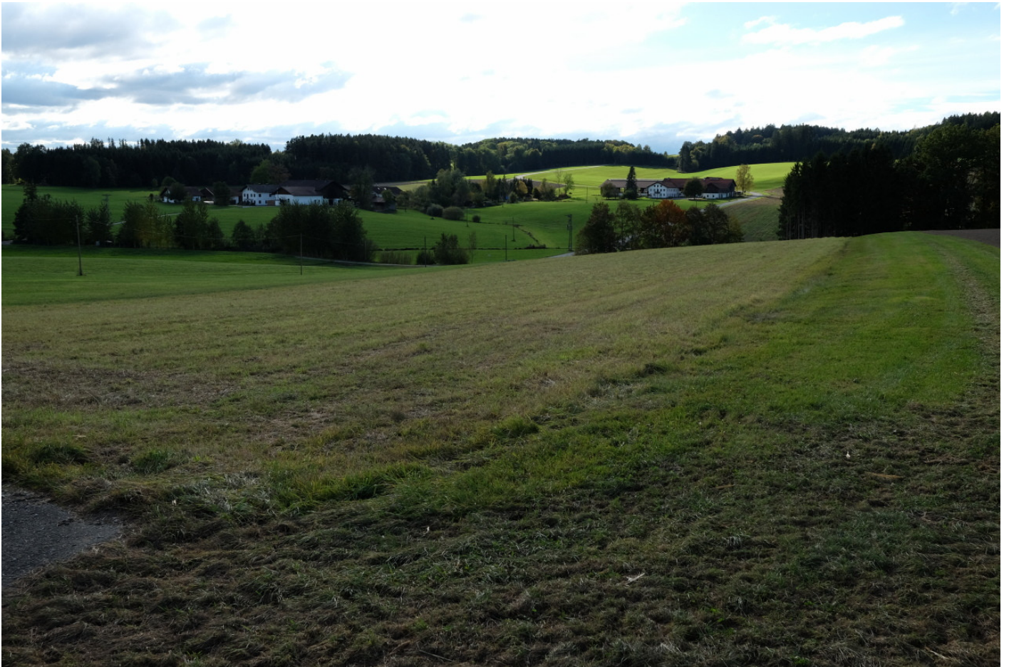
Von Isen nach Oderbuch: