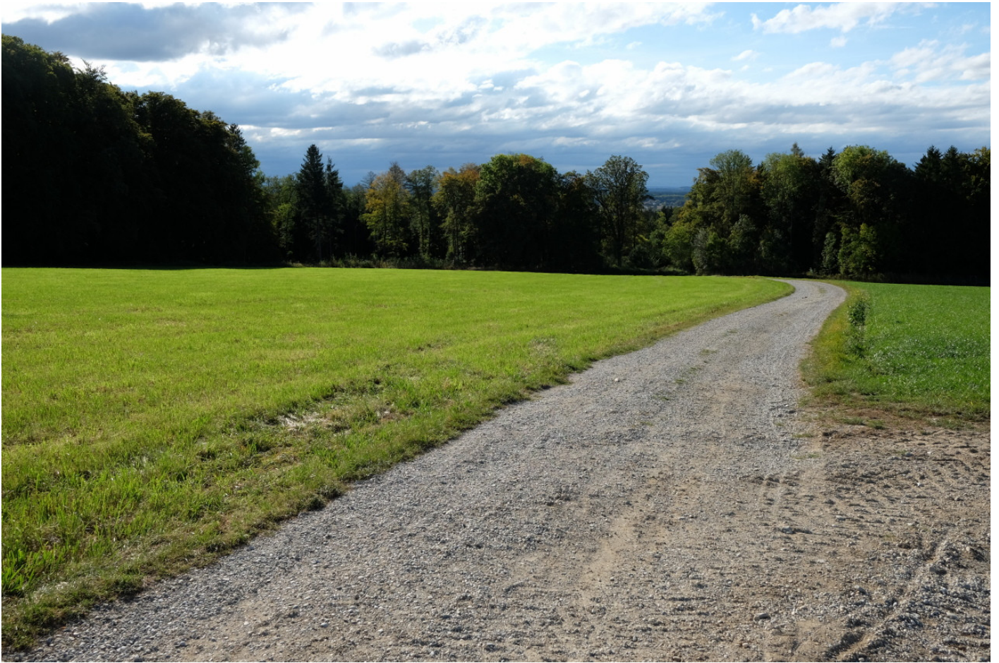
Auf der Anhöhe: