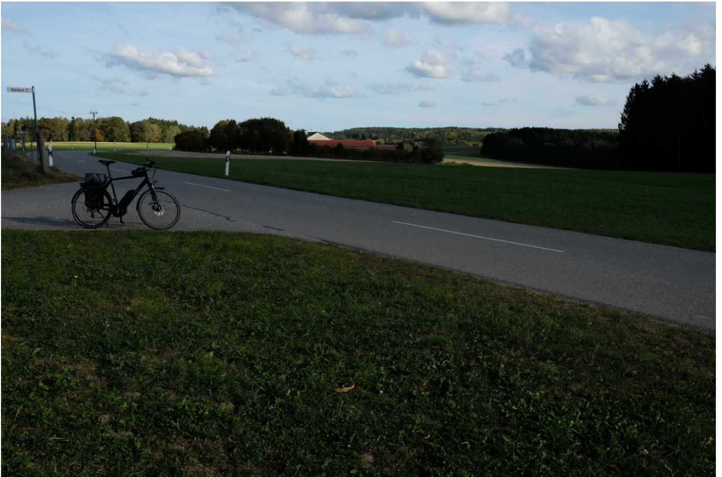
Blick auf Tading hinter Oderbuch: