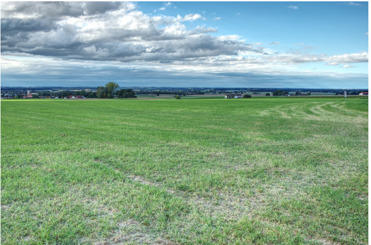
Das war die kleine Fototour rund um Forstern.